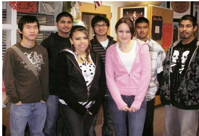
Casa Grande High School

Con el uso de estrategias de Instrucción Académica Especialmente Diseñada en Inglés (SDAIE) de instructores calificados, así como el apoyo de Asistentes Bilingües, los estudiantes tienen una gran oportunidad para triunfar en completar los cursos que son requeridos para graduarse al igual que pasar el examen de egreso de la preparatoria de California.