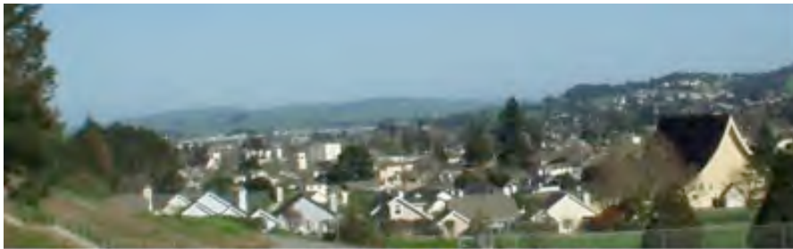
The view of Petaluma from PJHS